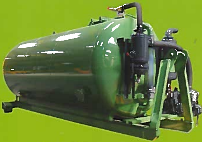
Citerne 15000 litres avec groupe de pompage