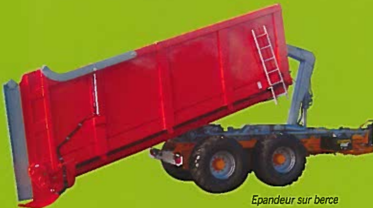
Epandeur sur berce