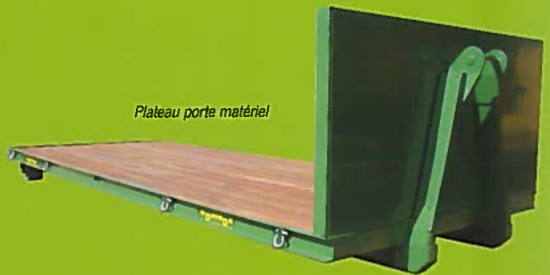
Plateau porte matériel