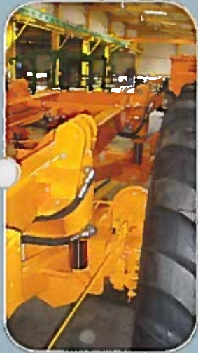
Suspension hydraulique sur train roulant