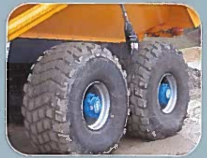
Essieux moteurs avec assistance hydraulique POCLAIN