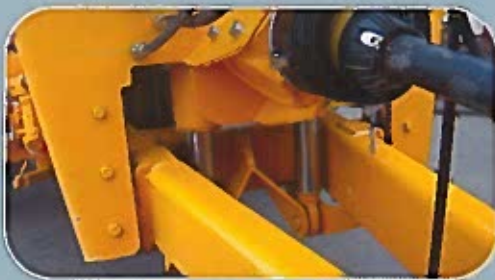
Flèche à suspension hydraulique