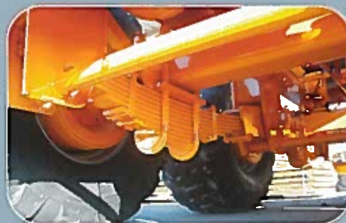
Essieu tandem à bielle