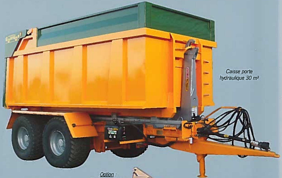
Caisse porte hydraulique 30 m³