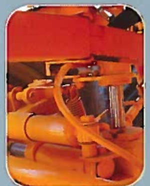
Blocage essieu arrière (anti-cabrage)