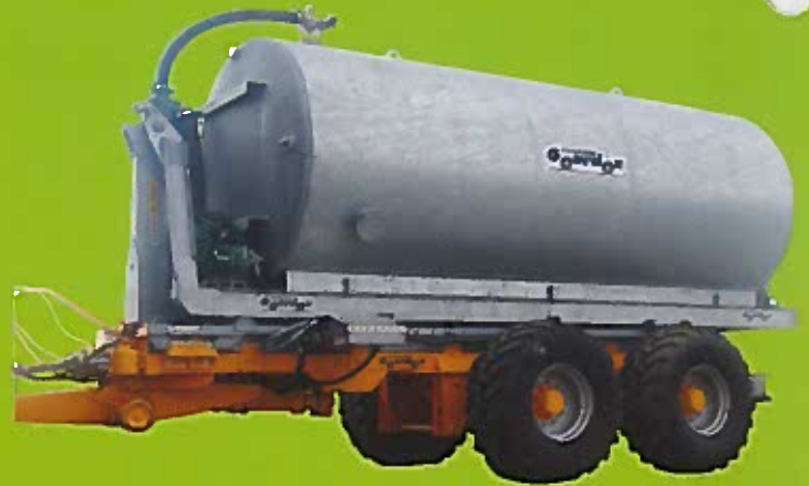
Citerne galvanisée 16000 litres