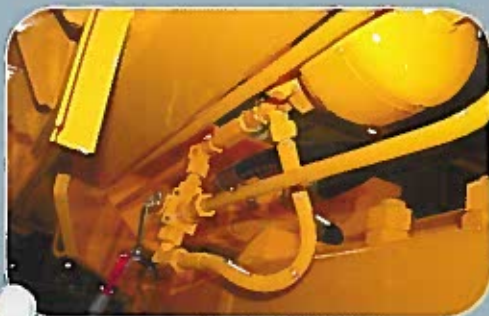
Frein de secours à réserve d'énergie