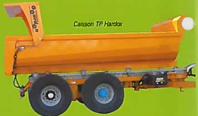
Caisson TP Hardox